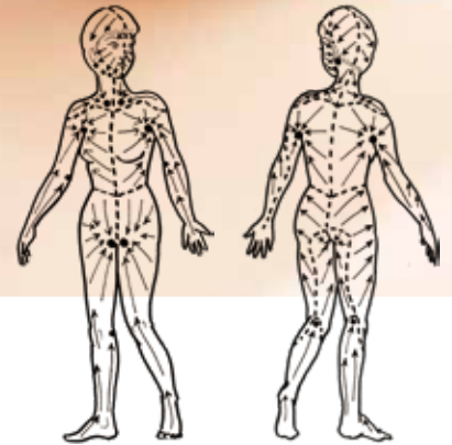
▲表在リンパ管の排水方向