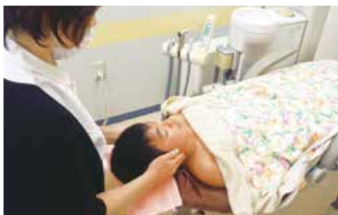
MLDサロン Antrieb (アントリイブ)