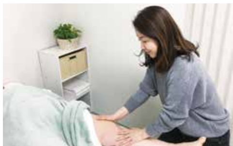
大阪あべのリンパ浮腫クリニック、わたなべクリニック、リンパ浮腫ケアセンター・ベルズハウスに勤務。 NPO 法人乳がんサポートグループ VOICE 理事