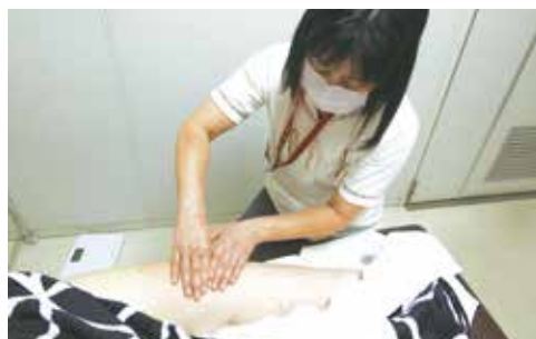
医療法人 榎本会 榎本病院 看護師長