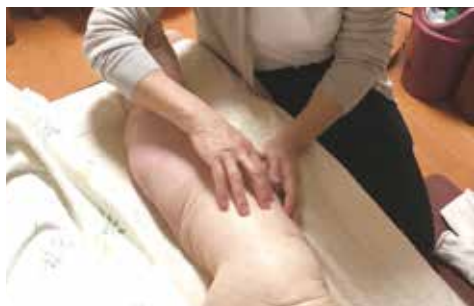
Life's Touch by 京子