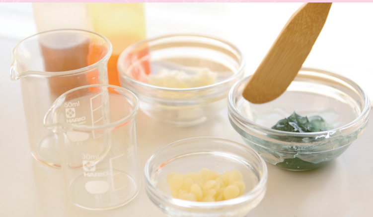
基材・・・ミツロウ、クリームベース、グリセリン、乳化剤、キサンタンガム etc