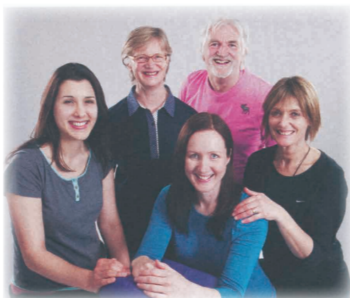
▲「ロイヤルフリーホスピタル」補完療法チーム

ロイヤル・フリーホスピタルはヨーロッパ中から患者が集まるロンドンの大病院です。そこで20年以上にわたり、何十万人もの患者さんをマッサージしてきた中に決して忘れることのできない患者さんたちがいます。その方々は、皆、難病によって大変な苦痛の中にあり、余命が短いにもかかわらず、私が彼らの病室を訪れて行うマッサージの時間をとても楽しんでくれました。一方で、私自身も、彼らの生きる姿勢から大変貴重なことを教えられました。悲しいことも多いけれども、最後は彼らに対する尊敬の念と、暖かな気持ちで心が満たされるのです。病も年齢も様々でありながら、深く私の心に残った患者さんたちのケースもご紹介しながら、技術やノウハウに加え、患者さんへマッサージをすることの意義や感動、そして、病院でマッサージをするときに常に頭に置いて置いていただきたい重要なポイントをお伝えします。