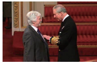
▲英国王室から大英帝国勲章(MBE)を授与された時の様子